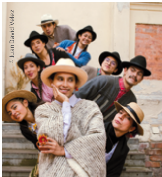
Compañía Sas Bequia Danza