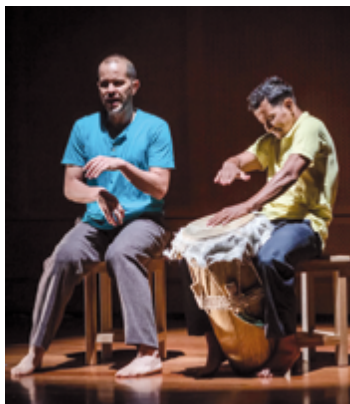
Compañía Danza Común